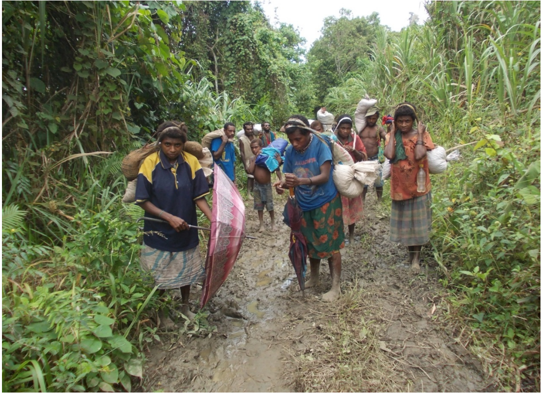
فقر درگینه نو