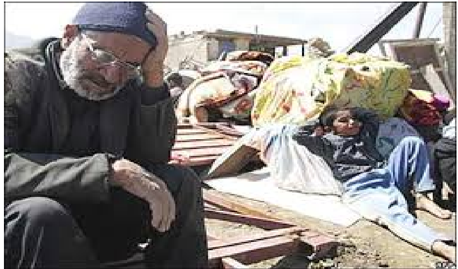
تصویر فقر در افریقا