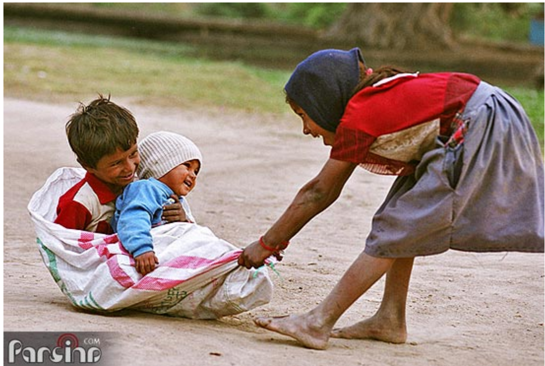
تصویر فقر در آسیا