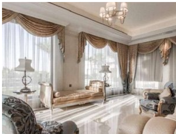
امارات: ملکی ۲۳ هزار فوت مربعی با معماری داخلی ایتالیایی، ۴۷/۶ میلیون دلار