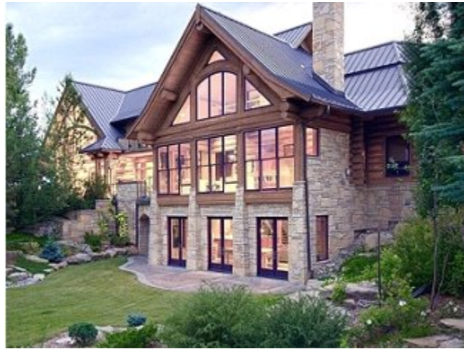
کانادا: ملکی مخصوص اسب سواری در دامنه کوه های راکی، ۳۰ میلیون دلار