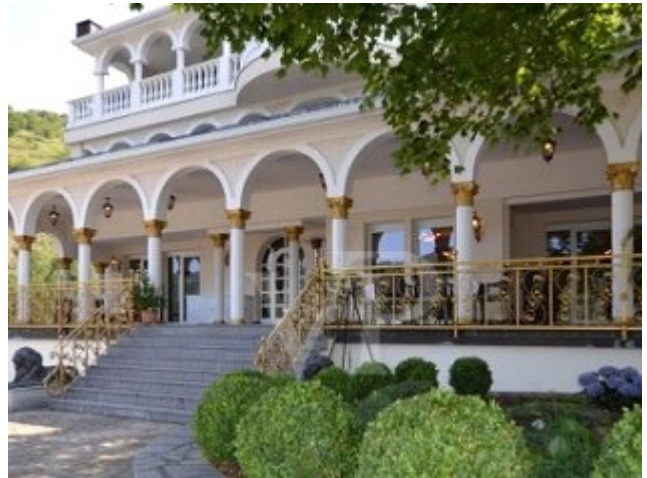
آلمان: ویلایی مشرف به رود راین، ۲۲/۳ میلیون دلار