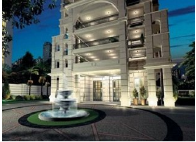
برزیل: ویلای لوکسی در سائوپائولو به قیمت ۲۴/۴ میلیون دلار