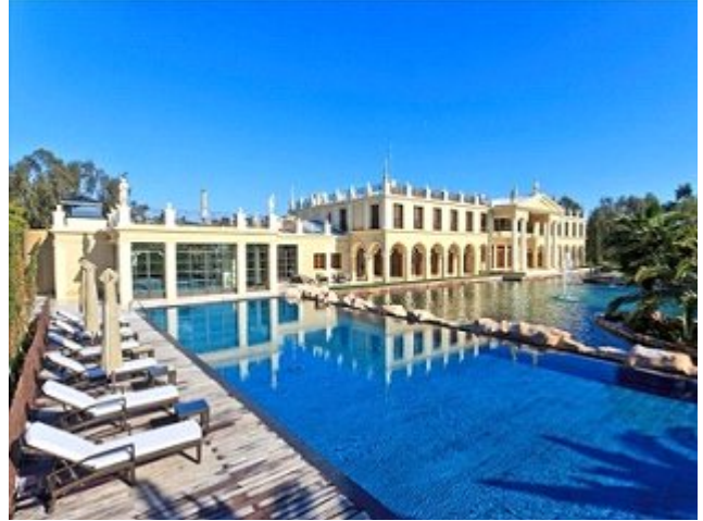
فرانسه: ویلای ۲۳ هزار فوت مربعی در کن و دارای ۳۲ اتاق و دید پانوراما از کوه های آلپ، ۱۱۲ میلیون دلار