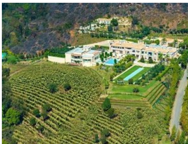
امریکا: ملکی ۲۵ هکتاری در لوس آنجلس، ۱۹۵ میلیون دلار