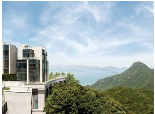
چین: خانه ای با تراس مشرف به بندرگاه ویکتوریا، ۱۰۵/۶ میلیون دلار