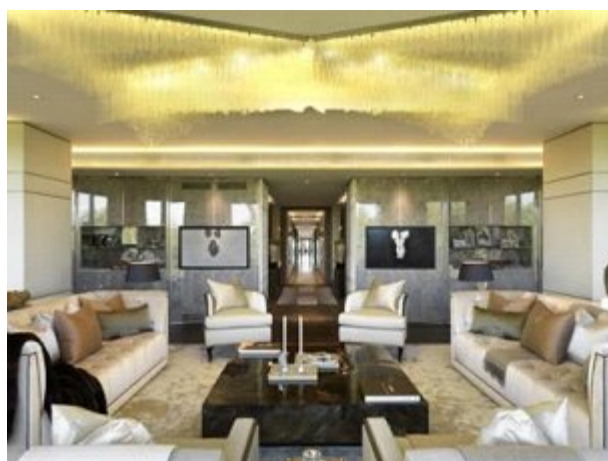
بریتانیا: آپارتمانی با وسعت ۹ هزار فوت مربع و واقع در هاید پارک لندن، ۱۰۲ میلیون دلار