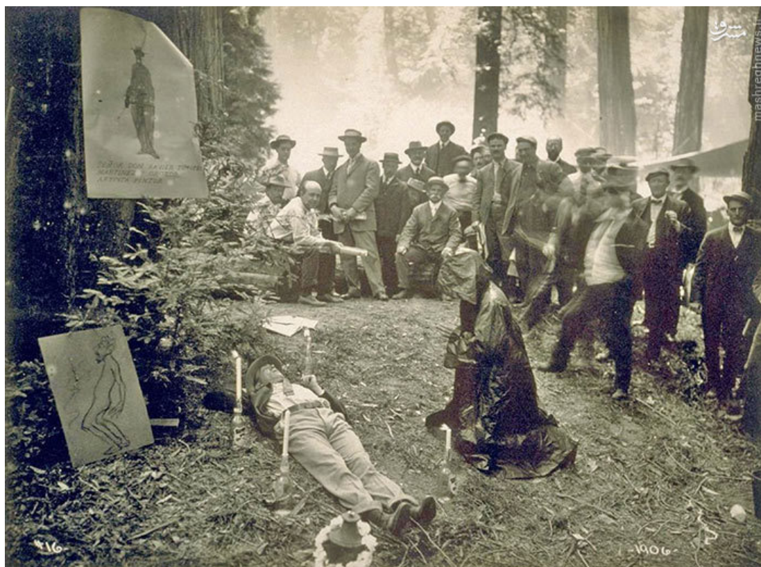
- 1906 پارک بوهمی ها (بوهمیان)